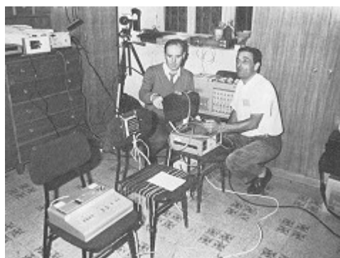
7 ottobre 1984: installazione delle apparecchiature prima dell'estasi dei dott. Joyeux e Philippot (a destra)

Quando ha inizio l'estasi il ritmo beta scompare e si passa al ritmo alfa puro, che è quello dei mistici, dei monaci in preghiera, ossia di contemplazione senza più riflessione. Prima dell'estasi Ivan sobbalza a un rumore di 70 decibel; durante l'estasi, Ivan non reagisce all'impatto con un rumore di 90 decibel (un motore a scoppio a pieno regime).